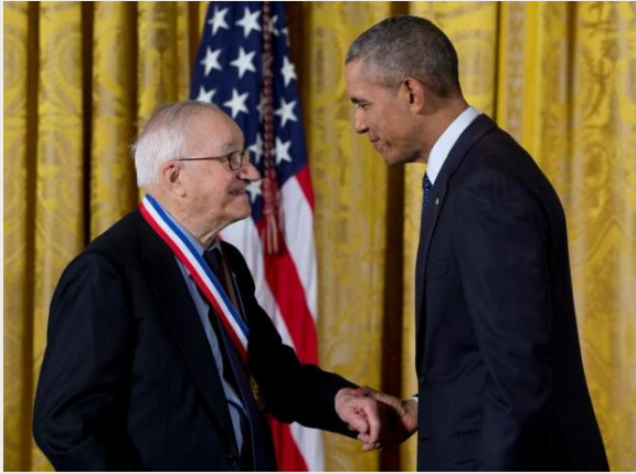
Albert Bandura 1925-